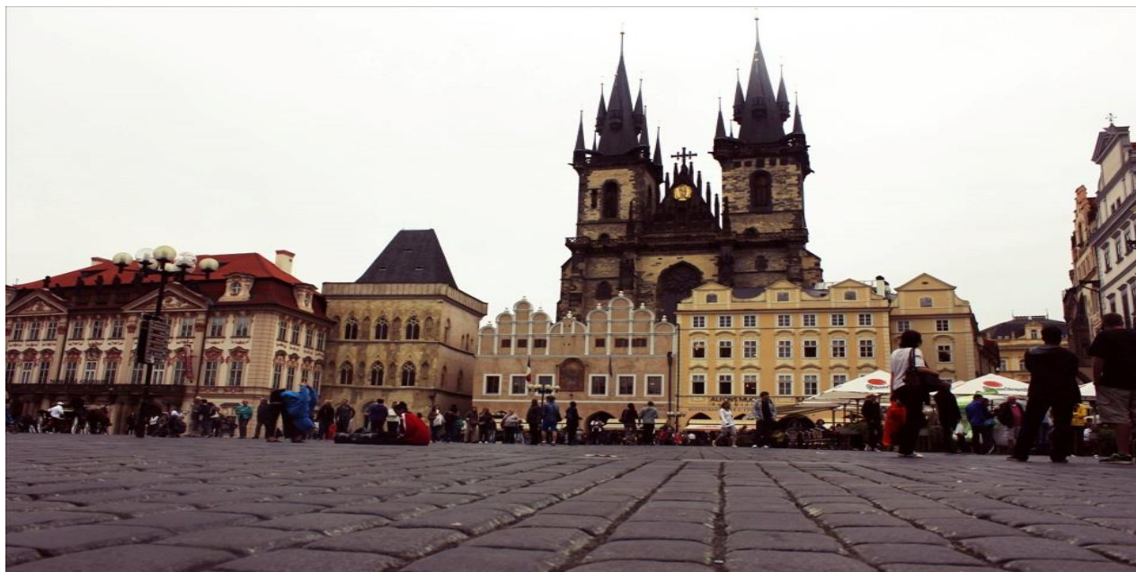
Crkva naše Gospe pod Týnom