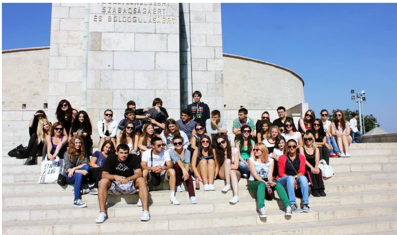
Maturanti 4. a, e i f razreda